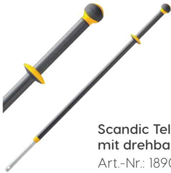
Scandic Telestiel mit drehbarer Kugel Art.-Nr.: 18903