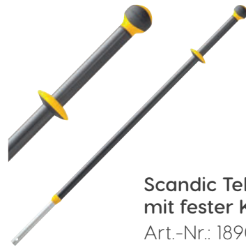
Scandic Telestiel mit fester Kugel Art.-Nr.: 18907