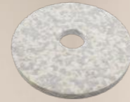
Duo Pad Art.-Nr. 201.077

Die Scheibenmaschine ZEUS ist ein Meisterstück an Ergonomie und Innovation für die professionelle und anspruchsvolle Reinigung von Hartflächen und Textilbelägen.