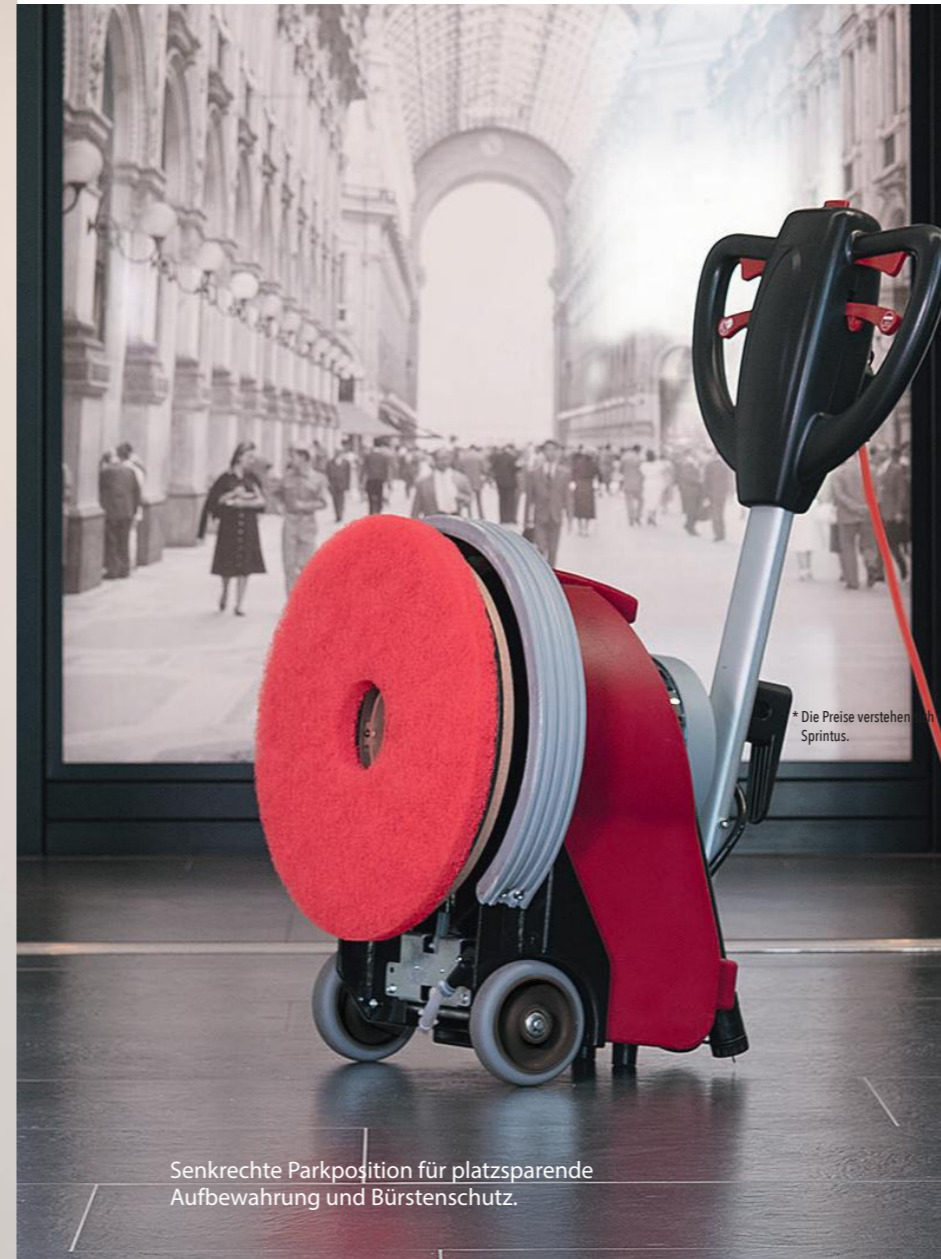
Senkrechte Parkposition für platzsparende Aufbewahrung und Bürstenschutz.

* Die Preise verstehen sich netto zuzüglich der gesetzlich gültigen Mehrwertsteuer und pro Stück ab Lager SPRINTUS.