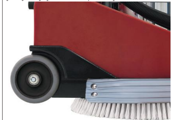
Große, nach hinten versetzte gummierte Räder für einfachen und geräuscharmen Transport.