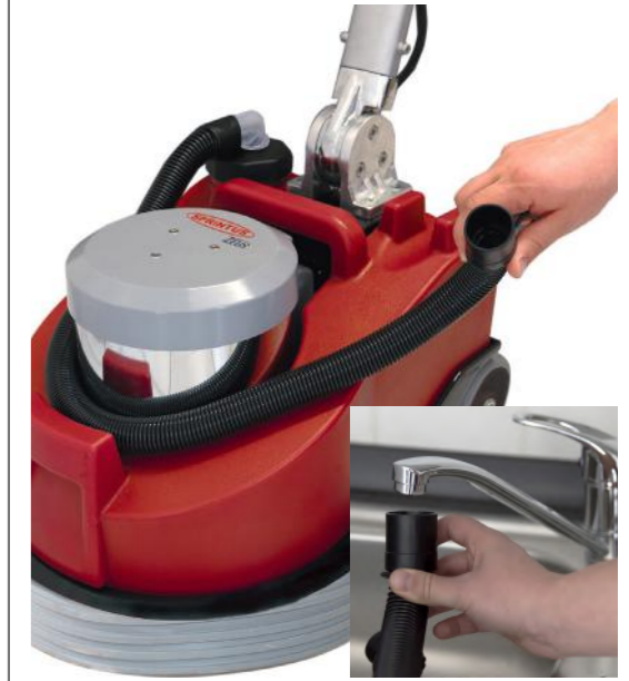
Frischwassertank kann mittels Stretschlauch direkt am Wasserhahn befüllt werden.

* Die Preise verstehen sich netto zuzüglich der gesetzlich gültigen Mehrwertsteuer und pro Stück ab Lager SPRINTUS.