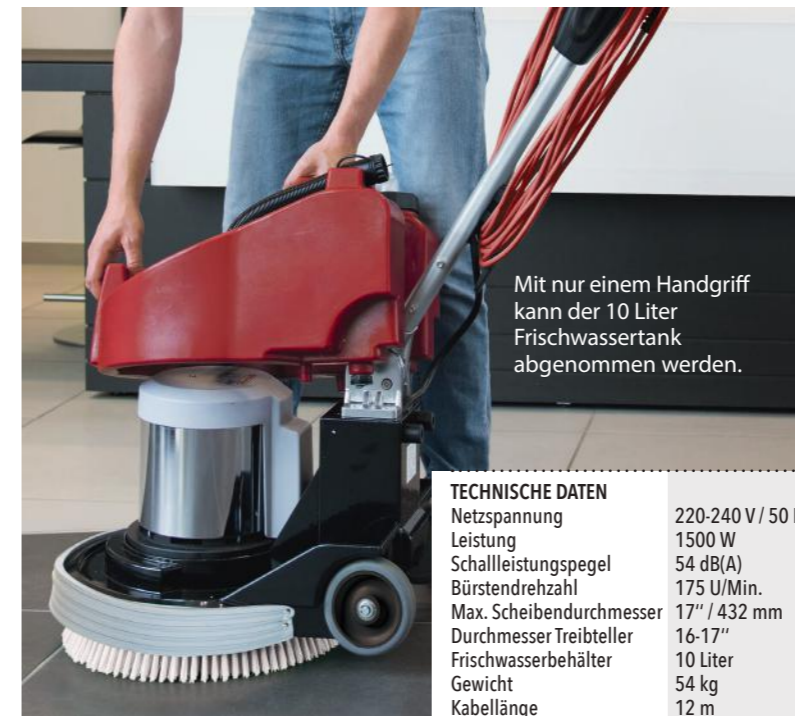
Mit nur einem Handgriff kann der 10 Liter Frischwassertank abgenommen werden.